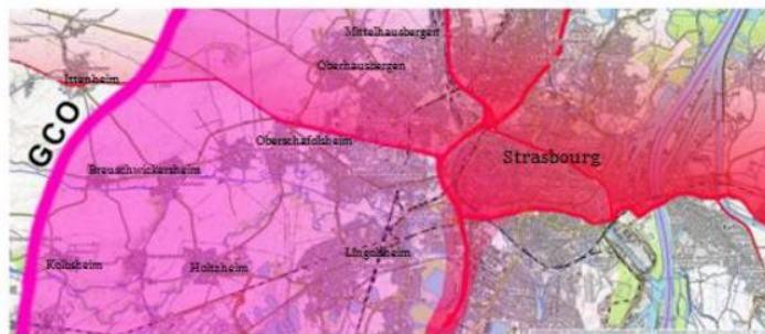
Le même schéma avec cette fois-ci l'apport de pollution de la future autoroute de contournement (GCO) et son impact sur des communes et quartiers auparavant préservés.

La pollution sur Strasbourg et l'Eurométropole AVEC le GCO