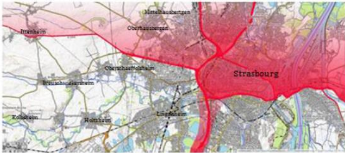
Sur le schéma ci-dessus est représentée l'influence des vents dominants Sud-Ouest sur la diffusion de la pollution automobile des axes de circulations principaux.

La pollution sur Strasbourg et l'Eurométropole SANS le GCO