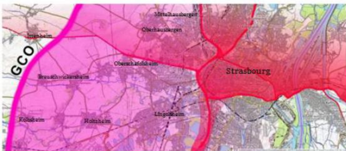
Le même schéma avec cette fois-ci l'apport de pollution de la future autoroute de contournement (GCO) et son impact sur des communes et quartiers auparavant préservés.

La pollution sur Strasbourg et l'Eurométropole AVEC le GCO